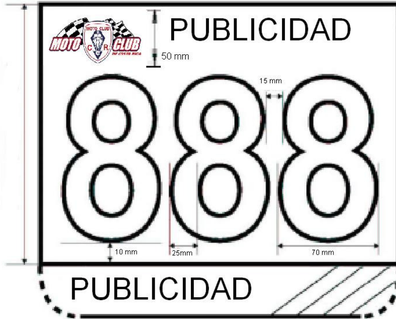
Figura 1. Dimensiones plato delantero